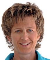
Leta à Porta-Ritz Presidenta dal cussagl administrativ