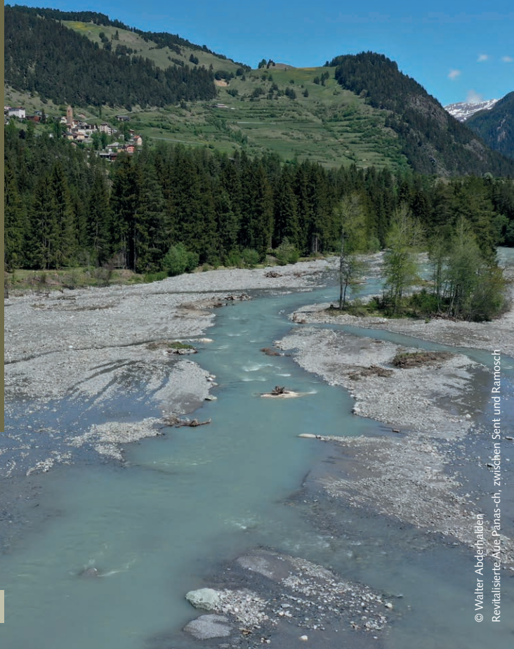
Revitalisierte Aue Panasch zwischen Sent und Ramosch

Dienstag, 9. Juni 2020 / Mardi, 9 giun 2020